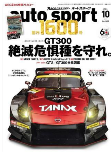
写真は10月号のもので