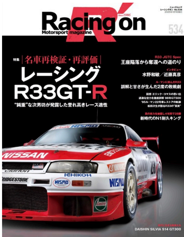
*表紙は2024年発売のNo.534のものとなります。

第一営業企画局代表メールアドレス : koukoku_01@san-ei-corp.co.jp