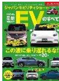
表紙はイメージです

謹啓 貴社益々ご清栄のこととお慶び申し上げます。また、平素より弊社刊行物に絶大なご協力を賜り心より御礼申し上げます。