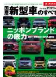
表紙はイメージです

謹啓 貴社益々ご清栄のこととお慶び申し上げます。また、平素より弊社刊行物に絶大なご協力を賜り心より御礼申し上げます。