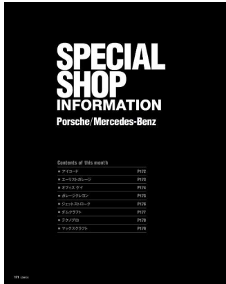
GENROQ本誌 「SPECIAL SHOP企画」