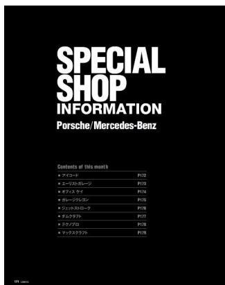
GENROQ本誌 「SPECIAL SHOP企画」