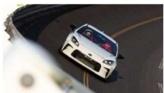
「HKS旗艦店のGR86がバンクにリベンジ！」NAチューンのままで250キロの台突破なるか...