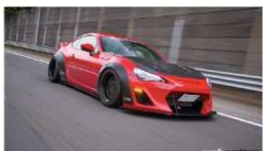
「さすがは時代の寵児」リパティエウォークのZN6型86ワークススタイルがカッコ良すぎる件...