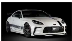
「お手軽ECU書き換えでGR86&BRZを15馬力アップ！」ブリッツ製のチューニングECU...

WEBへ転載 web option EXCITING CAR WEB MAGAZINE