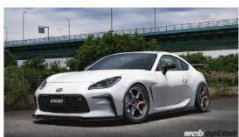
「ガンメタに映えるオレンジが高性能の証」グラムライツ57D「スベックD」とGR86の解烈コラ...