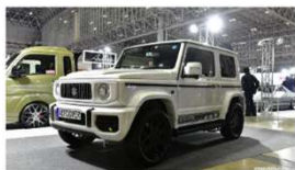
エアオーバーのG62Sは、アウターヒンジやモールなど細部までグレンデックを再現！