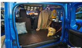
スマートにスマホが置けるダッシュボードレイラゲッジ用のラバーマットなど、ジムニーオーナー...