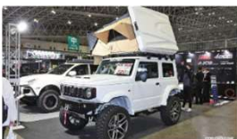
豪快な6インチアップでジムニーをアクティブなスタイルに！ 初心者におすすめの2インチ&3インチ...