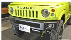
街角で映える可愛らしさが魅力のジムニー！ KLCのジムニーはストリートがよく似合う！