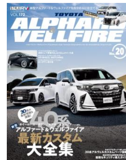
<前号vol.172の表紙画像です>