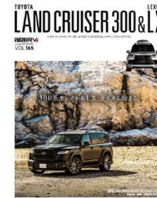
※画像は前号の表紙です

最新メーカーデモカーカタログ/ホイールカタログ/ホイールマッチング エクステリアセンスアップ講座/インテリア・グレードアップメニュー コンプリートカー購入ガイド/ドレスアップショップリスト/オーナーカー紹介 ラグジュアリーグッズカタログ/AV& セキュリティグレードアップ/ランクル250速報ほか ※上記内容は追加・変更される事がございます。