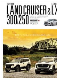
※画像は前号の表紙です