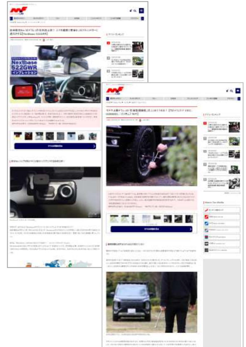
タイアップ記事（例）