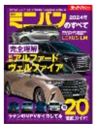
最新ミニバンのすべて