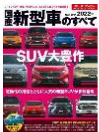
国産新型車のすべて