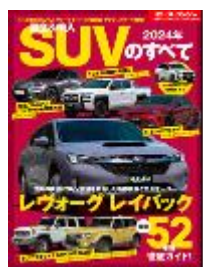
国産&輸入SUVのすべて