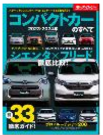
コンパクトカーのすべて