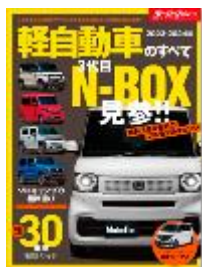
軽自動車のすべて