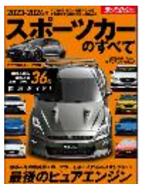
スポーツカーのすべて