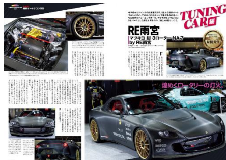
ご出稿と連動して取材→誌面掲載

(※注2) 基本は極力早めの転載記事作成と公開を実施しますが、公開日の指定などは出来かねますのでご了承ください。