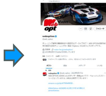
Xにて投稿サービスいたします！